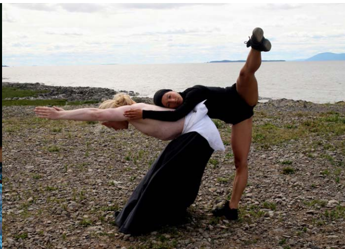
Graphisme – M&A | Maude et Archambault