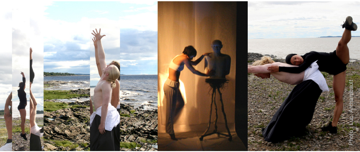
Graphisme – M&A | Maude et Archambault